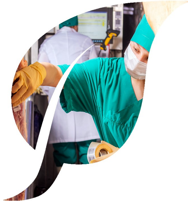
Fødevarerforarbejdning og følgeindustri